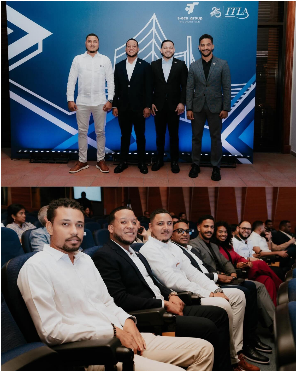
Participación en el Lanzamiento de #ITLAcademy desde Santiago 25/06/2025