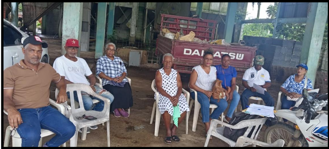
Asistencia de los consejos directivos de la cooperativa ozama